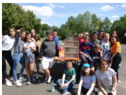
Voyage des jeunes de Hettstadt Du 05/07 au 10/07