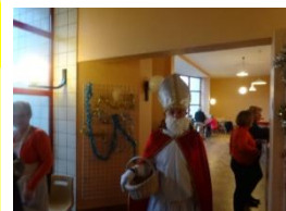
Marché de Noël Du 28/11 au 29/11