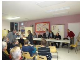
Assemblée générale 17 janvier à 20h30