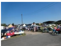
Foire aux greniers Le 6 septembre