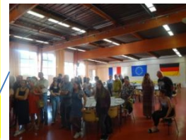
Rencontre des adultes à Hettstadt Du 20/05 au 24/05