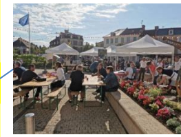
Fête de la musique 21 juin